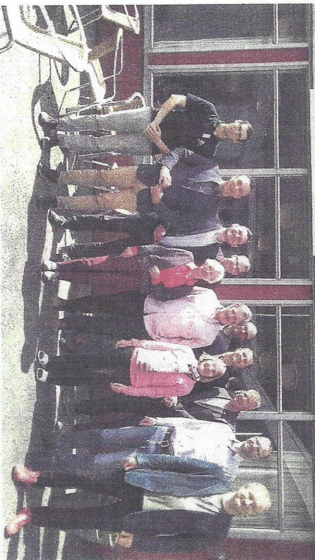
Delegacja zachodniopomorska z przedstawicielami Norwegii i Niemiec podczas spotkania w Bergen